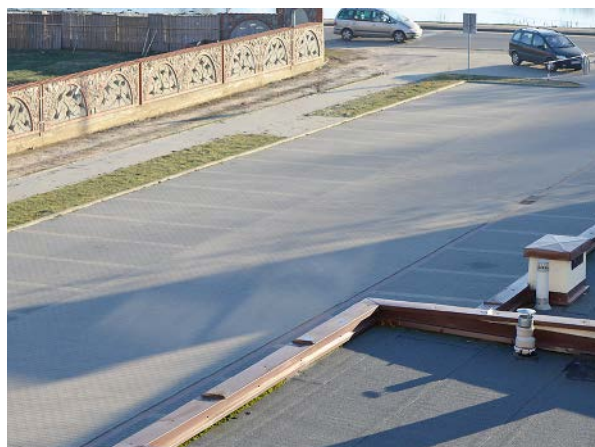
ZAMKNIĘTY PARKING PRZY UL. ZWM

Są pierwsze finansowe konsekwencje decyzji radnych. Powiatowy Inspek-