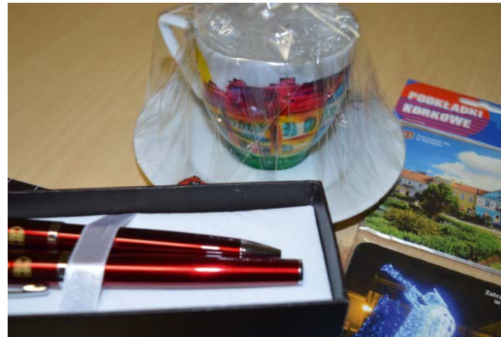
FIRMOWY ZESTAW NAGRÓD

Z liter w zaznaczonych na żółto polach należy przez anagramowanie utworzyć hasło. Osoba, która jako pierwsza 8 lutego 2016 r. w godz. 9:00-9:30 zadzwoni się do Referatu ds. Promocji, Konsultacji i Inicjatyw Społecznych Urzędu Miejskiego i poda rozwiązanie krzyżówki wygra zestaw upominków: komplet długopisów, filiżankę oraz podkładki korkowe. Numer telefonu – 23 663 13 34