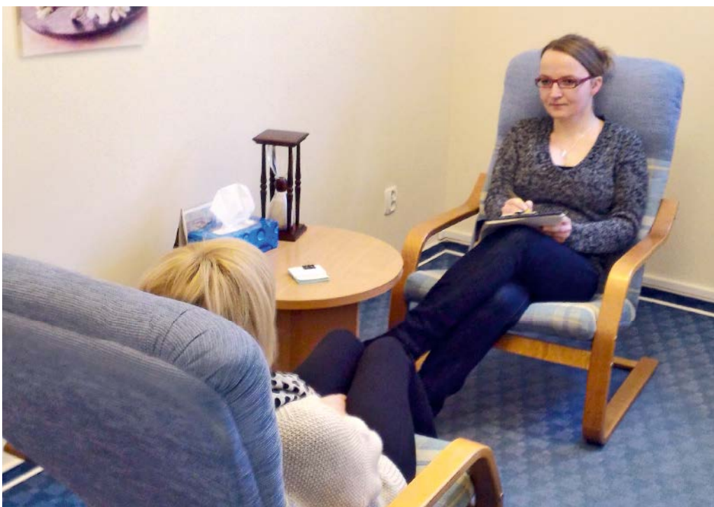
LECZENIE ALKOHOLOWOŚCI WYMAGA POMOCY SPECJALISTÓW

Efektywność leczenia choroby alkoholowej jest wprost proporcjonalna do poziomu motywowania i zaangażowania pacjenta, a odwrotnie proporcjonalna do presji i konfrontacji. Oznacza to, że największą rolę w procesie zdrowienia odgrywa zbudowanie indywidualnej, wewnętrznej motywacji do leczenia. Samo leczenie jest procesem długofalowym, wymaga systematycznej współpracy z placówkami lecznictwa odwykowego, czy grupami samopomocowymi Anonimowych Alkoholików i AL.- Anon. ■