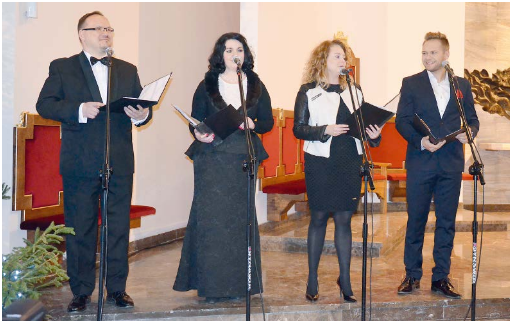
SOLIŚCI FILHARMONII NARODOWEJ W WARSZAWIE