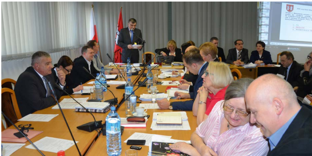
RADNI RADY MIEJSKIEJ PODCZAS XXII SESJI

Piszemy w tym numerze „Gazety Płońskiej” o decyzji Powiatowego Inspektora Nadzoru Budowlanego, który nało-