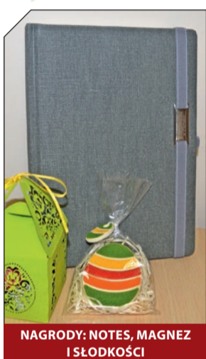
NAGRODY: NOTES, MAGNEZ I SŁODKOŚCI

Z LITER W ZAZNACZONYCH NA ZIELONO POLACH NALEŻY ODCZYTAĆ HASŁO. OSOBA, KTÓRA JAKO PIERWSZA 20 kwietnia 2017 r. o godz. 9:00 DODZWONI SIĘ DO REFERATU DS. PROMOCJI, KONSULTACJI I INICJATYW SPOŁECZNYCH URZĘDU MIEJSKIEGO I PODA ROZWIĄZANIE KRZYŻÓWKI WYGRA UPOMINEK. Numer telefonu 23 663 13 34