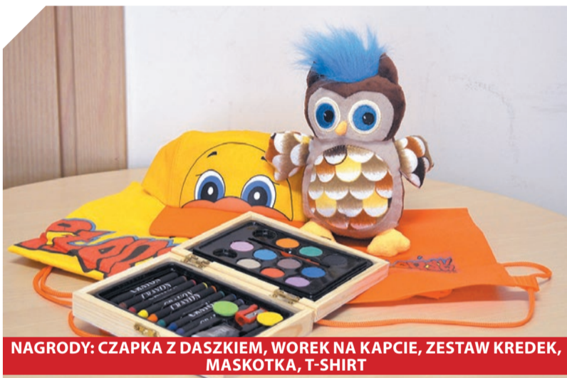
NAGRODY: CZAPKA Z DASZKIEM, WOREK NA KAPCIE, ZESTAW KREDEK, MASKOTKA, T-SHIRT