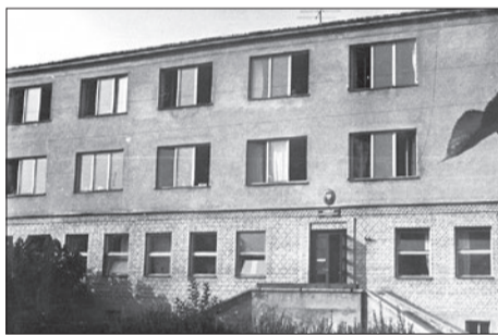
1962 | Budynek internatu