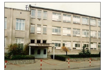
Wygląd wejścia do szkoły w latach 1974-2005