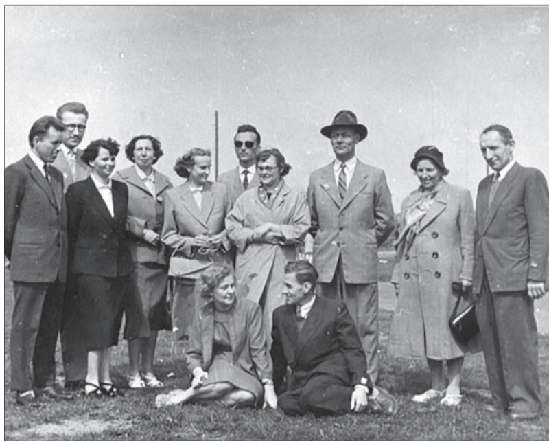
1952 | Rada Pedagogiczna

Z koleżeńskim pozdrowieniem Komitet Organizacyjny