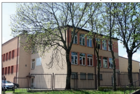
2011-2012 | Rozbudowa szkoły