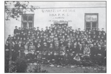
1922 | Gimnazjum Męskie w Płońsku