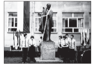
1978 | Odstąpienie pomnika H. Sienkiewicza