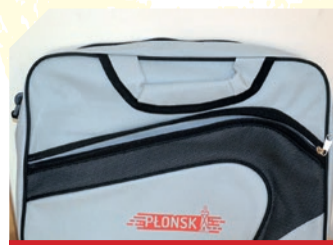
NAGRODA: TORBA NA DOKUMENTY