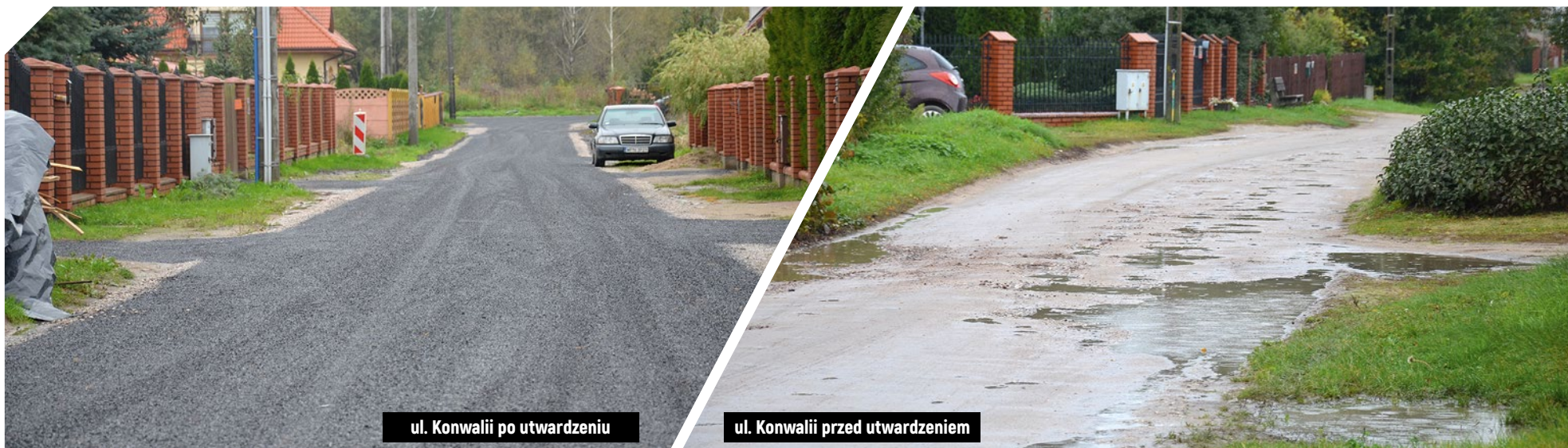
ul. Konwalii po utwardzeniu