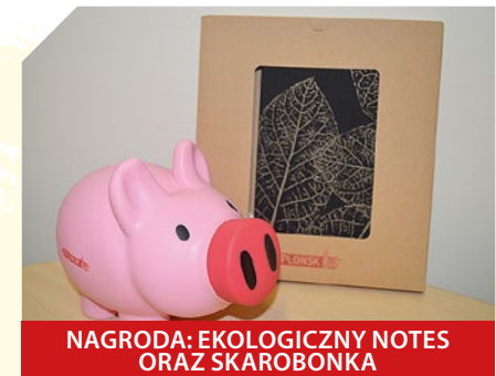
NAGRODA: EKOLOGICZNY NOTES ORAZ SKAROBONKA

Z LITER W POLACH ZAZNACZONYCH NA ŻÓŁTO NALEŻY ODCZYTAĆ HASŁO. OSOBA, KTÓRA JAKO PIERWSZA 4 listopada 2017 r. o godz. 9:00 DODZWONI SIĘ DO REFERATU DS. PROMOCJI, KONSULTACJI I INICJATYW SPOŁECZNYCH URZĘDU MIEJSKIEGO I PODA ROZWIĄZANIE KRZYŻÓWKI WYGRA UPOMINEK. Numer telefonu 23 663 13 34