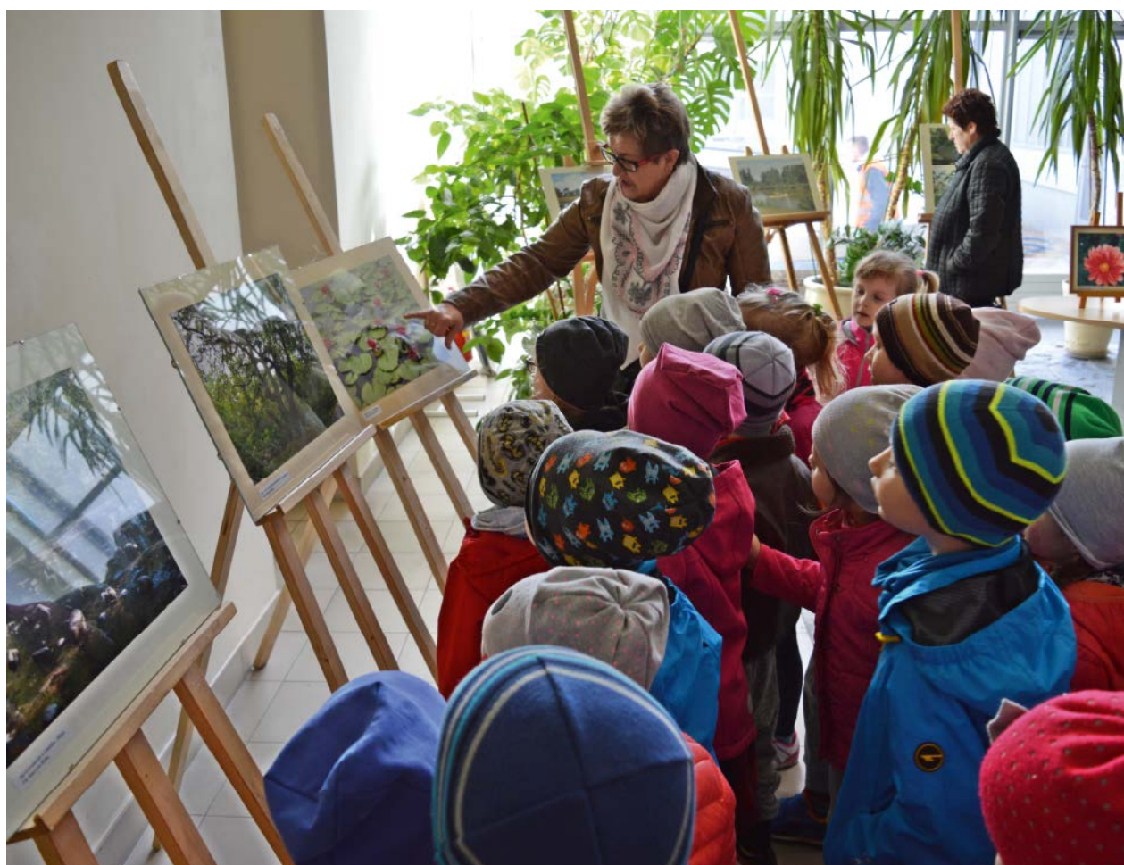
PRZEDSZKOLAKI ZAFASCYNOWANE WYSTAWĄ KATARZYNY RÓLKI

Wystawa cieszyła się dużym zainteresowaniem, nie tylko wśród mieszkańców. Prace fotograficzne podziwiali również dzieci z płóńskich szkół i przedszkoli.