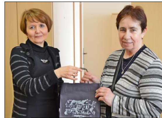
ZWYCIĘZCZYNI KWIETNIOWEJ KRZYŻÓWKI

Hasła 3, 4 i 5 są dwu- lub trzywyrazowe.